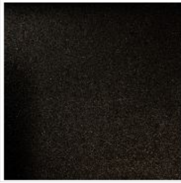
Juodas lakuotas nerūdijantis plienas