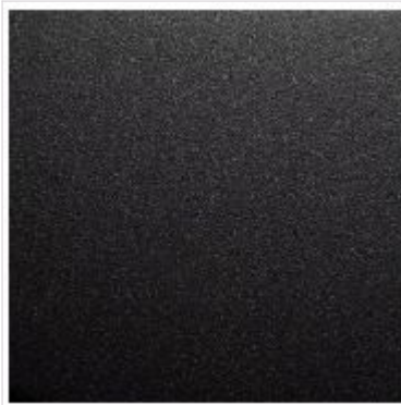
Lakuotas Karbono plienas